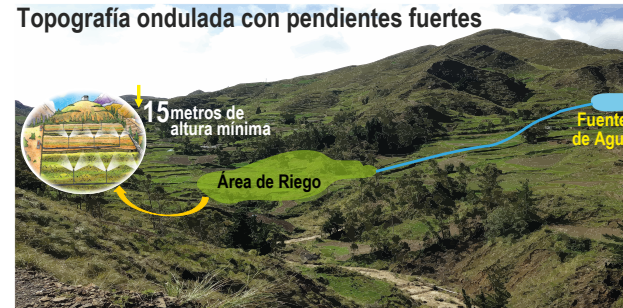
Figura 1. Desnivel necesario para el riego de aspersión

En sistemas con caudales mínimos de operación y donde existe un desnivel entre la fuente de agua y las parcelas agrícolas, es recomendable implementar sistemas de riego por aspersión. De esta manera, se evitarán costos energéticos adicionales, porque la energía de carga de presión es la gravedad. Para operar un sistema de riego por aspersión, se requiere como mínimo un desnivel de 15 metros de altura.