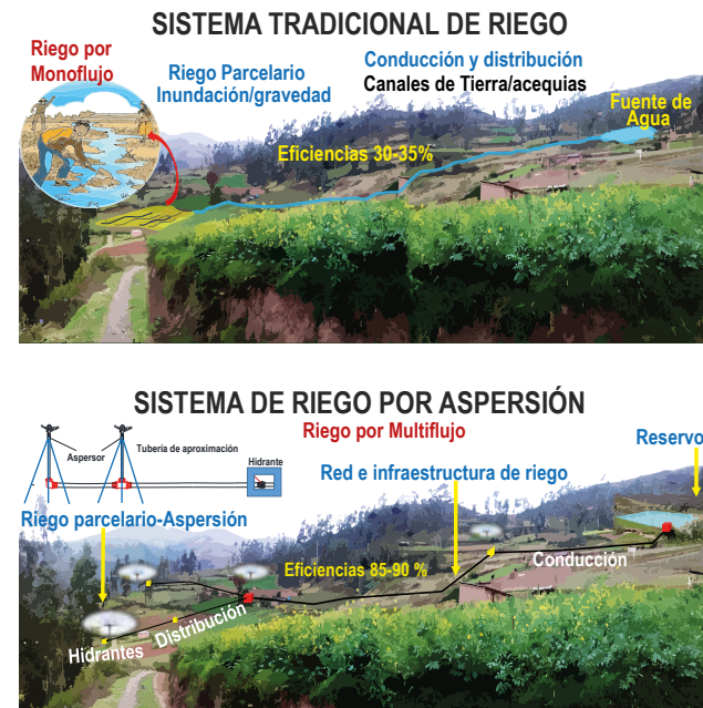
Figura 2. Riego multiflujo

La introducción de riego por aspersión implica el cambio de los esquemas de distribución de agua tradicional, mediante una rotación por Monoflujo (caudal entero repartido familia tras familia, según una secuencia establecida en turnos) a un esquema Multiflujo (caudal repartido equitativamente a varios usuarios que pueden regar al mismo tiempo) compatible con las características de la nueva tecnología.